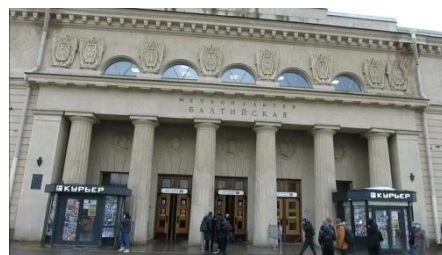
Выход: станция метро «Балтийская»