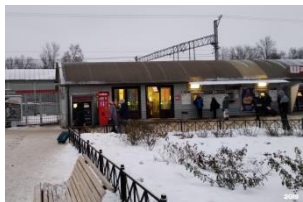
Вход: ж/д станция «Колпино»