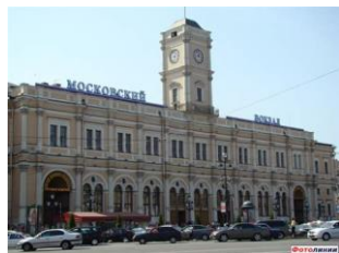
Выход: ж/д станция «Московский вокзал»