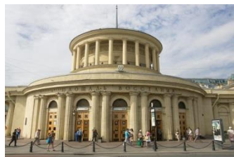
Вход: станция метро «Площадь Восстания»