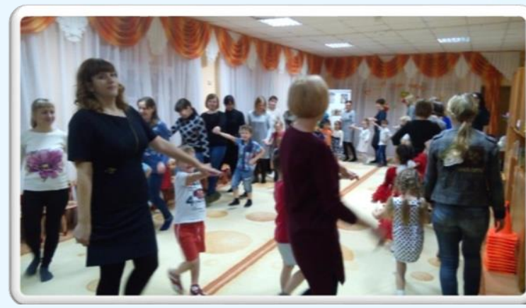
Проект «Мамы, как пуговицы, на них все держится»