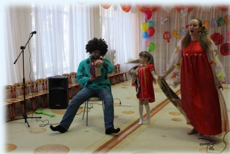
Фестиваль «Мама, папа я – Поющая семья»