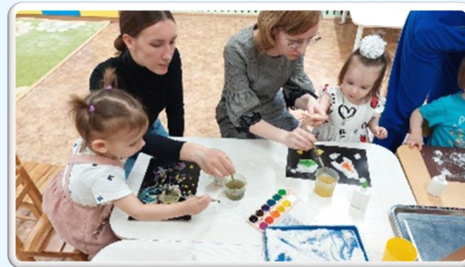
Проект «Космическое путешествие»