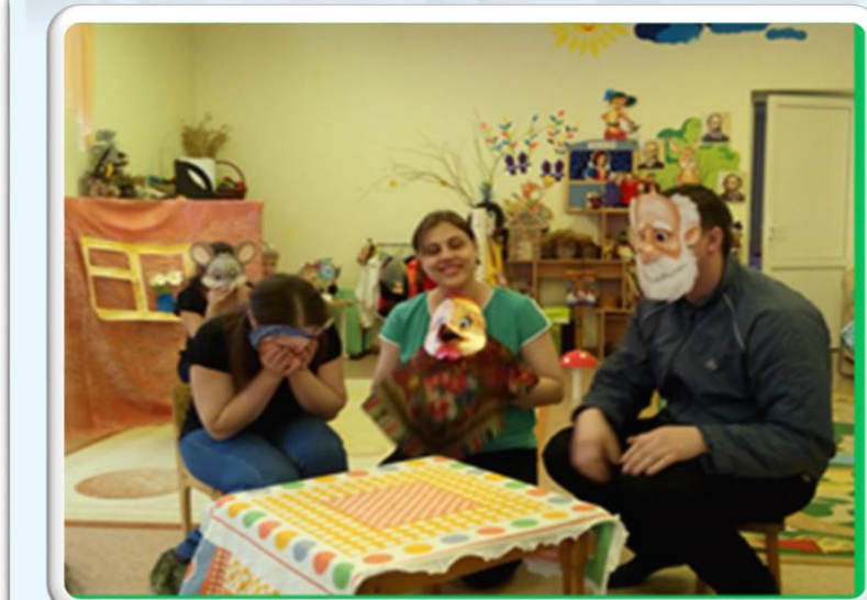
Проект «Платковый театр»