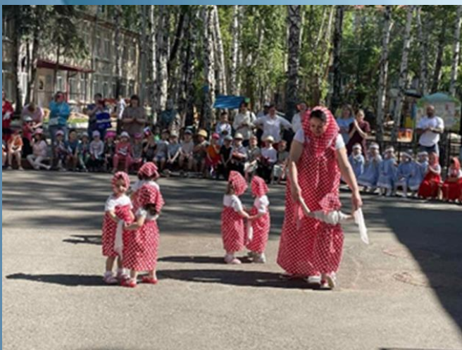
Фестиваль «Мы разные, но мы вместе» Танец «Матрешки»