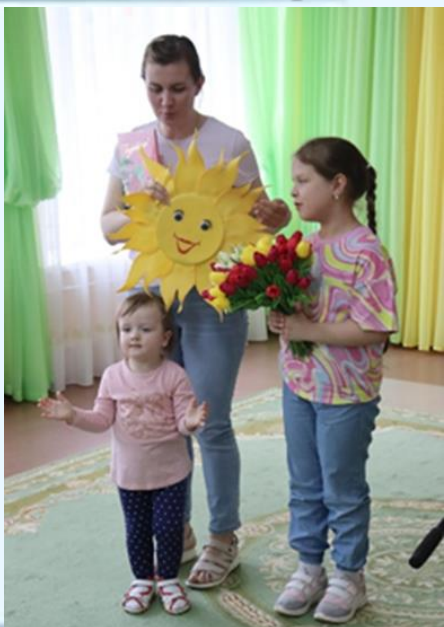
Фестиваль «Военной песни»