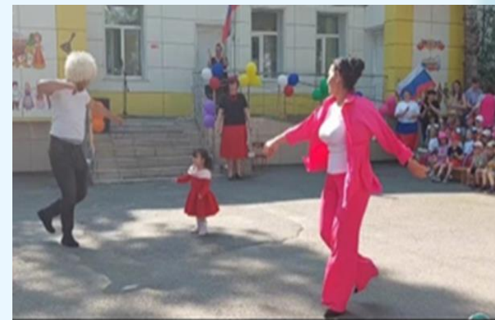
Фестиваль «Мы разные, но мы вместе» Танец «Лезгинка»