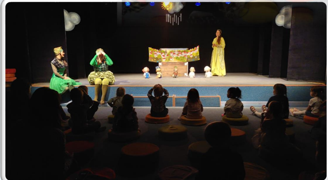
Клуб семейных выходных театр Ангажемент «Волшебный горочек»