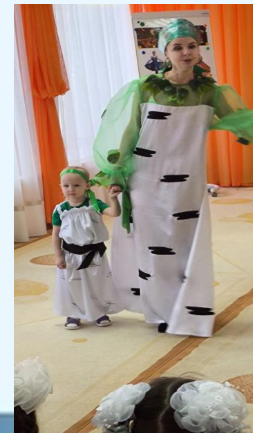
Фестиваль патриотической песни «О Родине, о доблести, о славе»