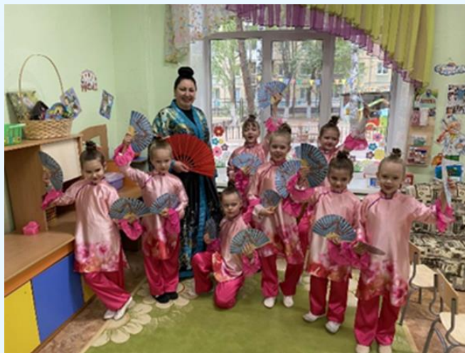
Фестиваль «Мы разные, но мы вместе» Танец «Китояночки»