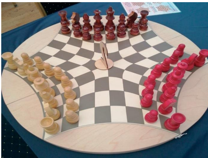
▲ Игровое поле и набор фигур для тригональных шахмат.

Но внешние отличия далеко не все особенности игры, у нее принципиально другой смысл и предназначение.