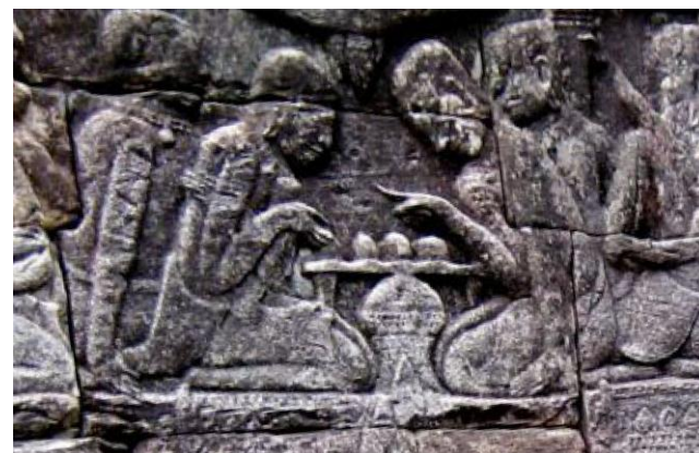
▲ Игра в сямские шахматы