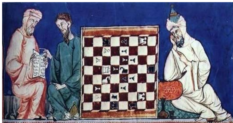
▲ Миниатюра с изображением игры в шахматы с христианскими и мусульманскими игроками ◀ «Роман о короле Мелиадусе». Два короля играют в шахматы, около 1352

ющие на эту роль) учатся править. Иными словами, шахматы — это игровой вариант управления, элемент символического представления тактики и стратегии. Шахматы – это алгоритмы социального поведения. В шахматах отражены поведенческие модели, которые эквивалентны конкретным поступкам в конкретных ситуациях и персонифицированы в игровых фигурах. Разнообразие шахматных фигур, соответствует разным социальным функциям, полномочиям, статусу и социальной иерархии. Они представлены в определённых правилах, по которым эти фигуры движутся по шахматному полю, что практиковалось в аристократической и орденовой среде.