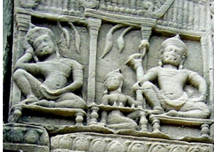
▲ Игра в шахматы. Тайланд I в. н. э

Какой же был первичный смысл игры в шахматы? Прародителями современных чёрно-белых шахмат были игры чатуранга, шатрандж, макрук. Все эти игры отражали модели социального поведения, соответствующие времени и традициям тех стран, когда и где они были созданы и культивировались.