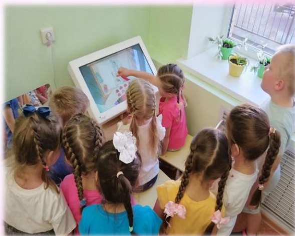
«Собери принцессу на бал»