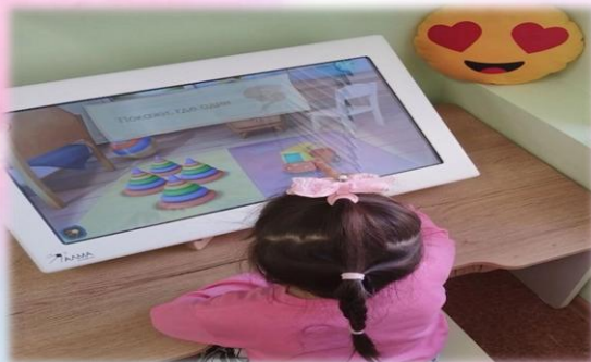
«Больше / меньше»