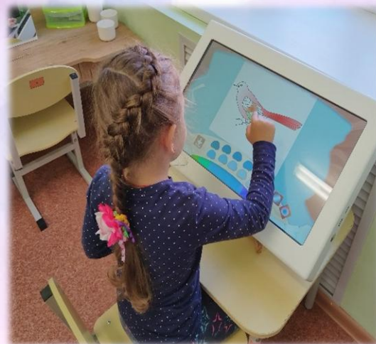
«Дорисуй / Раскрась»