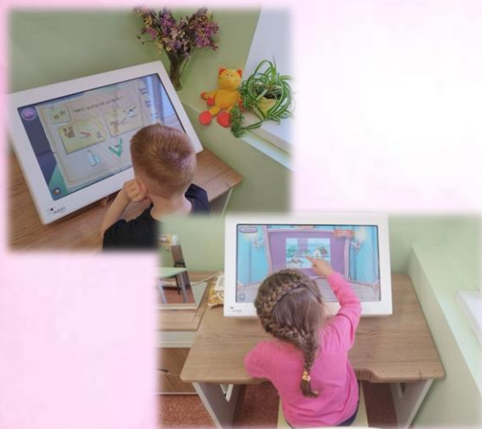
«Чего не хватает?»