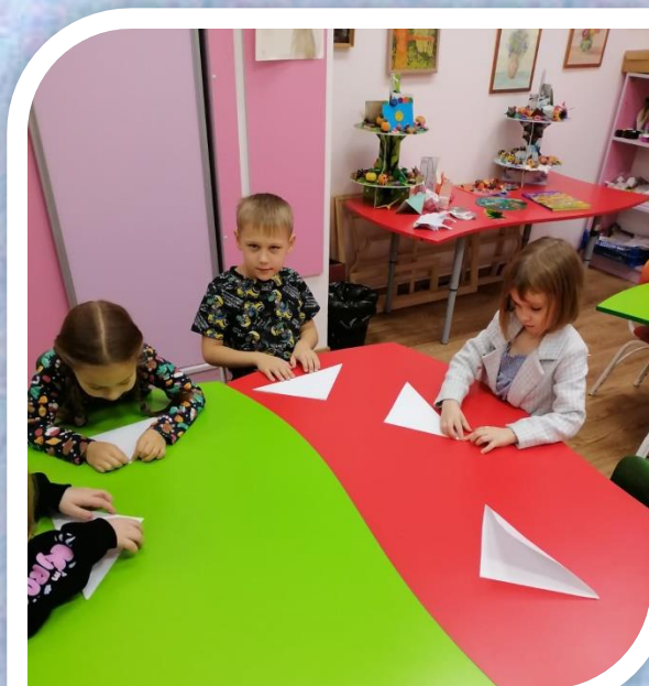
«рождение» бумажных шедевров»