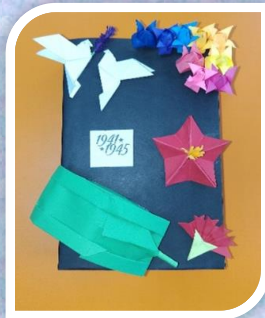
композиция «Никто не забыт, ничто не забыто!»