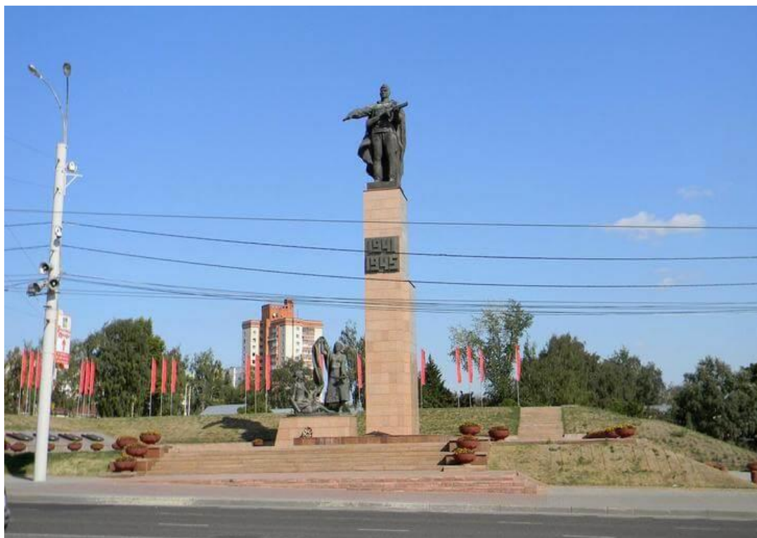
Мемориал героям фронта и тыла.

Побывали в таких памятных местах, как Мемориал героям фронта и тыла. Мемориал посвящен ивановцам, принимавшим участие в ВОВ, и трудившимся в тылу – всем, кто внес бесценный вклад в Победу.