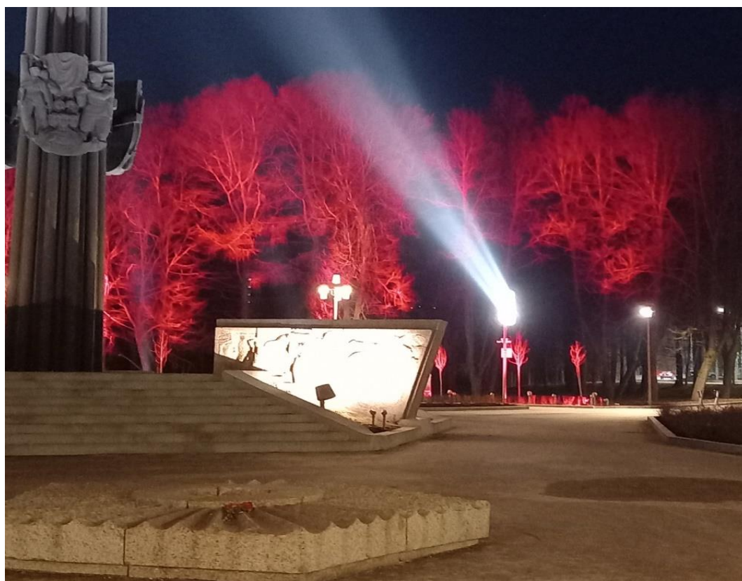
Мемориал «Красная Талка» памятник борцам революции.