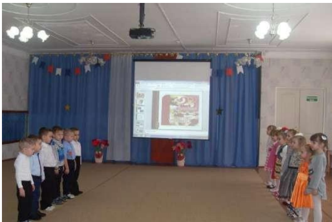
Праздник «Воинский долг- честь и слава»