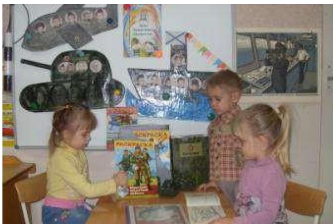
Рассматривание альбома «Наша армия»