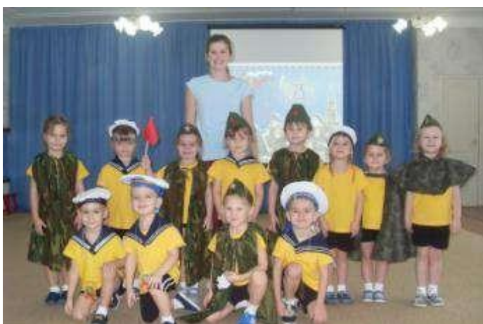
Спортивное развлечение «Самые ловкие и смелые»