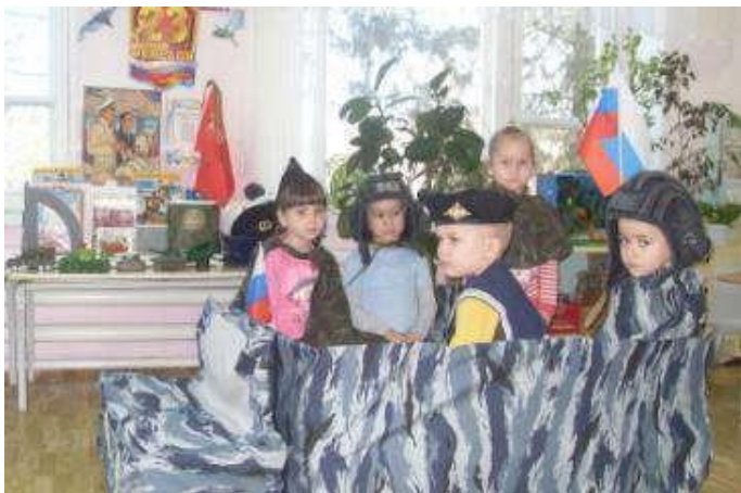
Сюжетно ролевая игра «На посту»