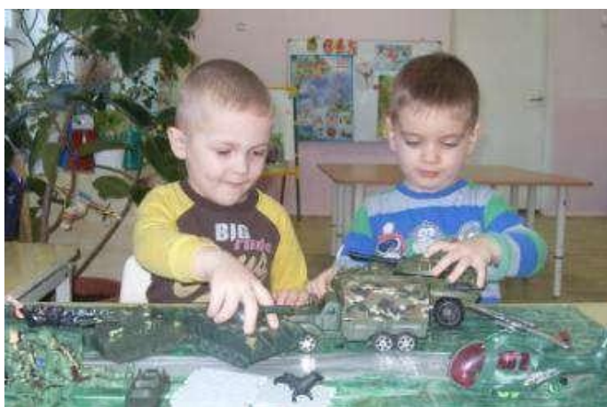
Сюжетная игра «Грянул бой»