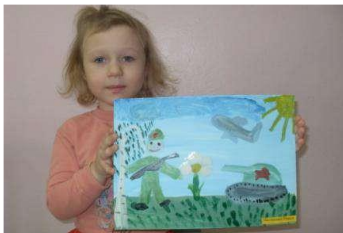
Открытка «23 февраля»