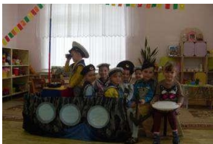
Сюжетно- ролевая игра «Военные моряки»