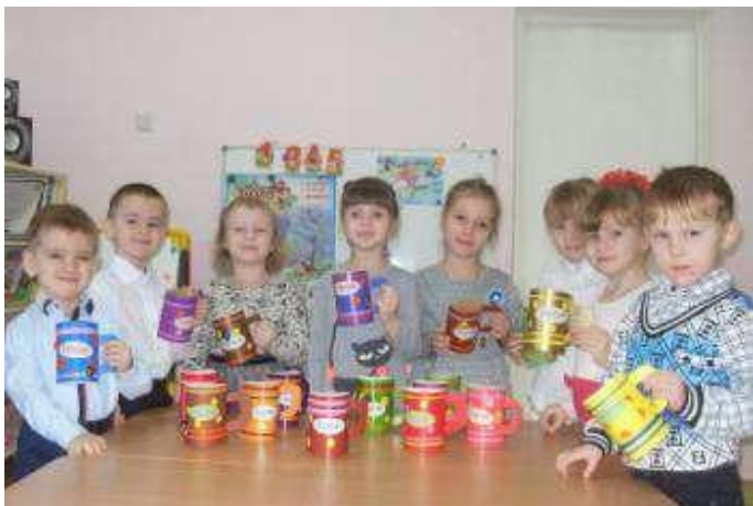
Подарки папам и дедушкам