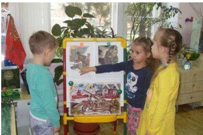
Беседа с детьми «Дети на войне»