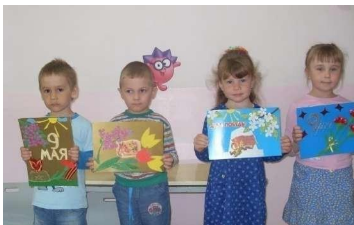
Акция «Открытка ветерану»