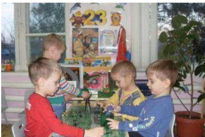
Игра «На заставе»