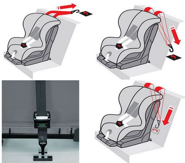
Рис. 7. Способы фиксации якорного крепления

После того, как автокресло установлено, необходимо учесть ряд условий при усаживании в него ребенка: