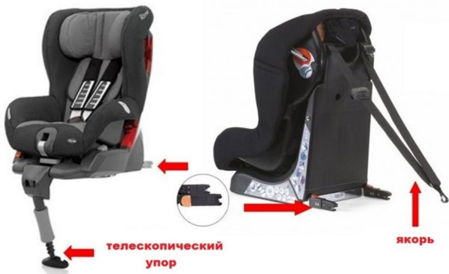
Рис. 6. Телескопический упор и якорное крепление

возможности «клюющего» движения при лобовом столкновении и этим обеспечить более высокую безопасность в аварийных ситуациях (Рис. 6).