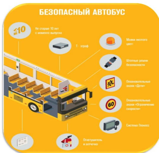
Рис. 8. Схема рейтинга безопасных мест в автомобиле

При организованной перевозке группы детей при движении автобуса на его крыше или над ней должен быть включен маячок желтого или оранжевого цвета (п. 3.4 ПДД в редакции постановления Правительства РФ от 23.12.2017 № 1621).