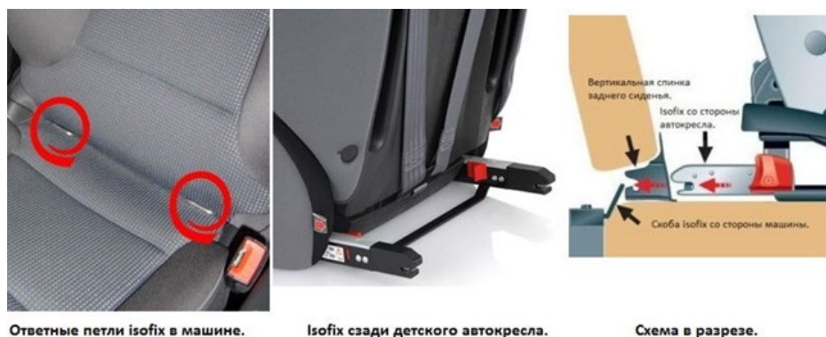
Рис. 5. Крепления ISOFIX

Крепления ISOFIX как самостоятельные используются для автокресел групп 0+/1 (до 18 кг), в которых ребенок фиксируется ремнями безопасности автокресла, которое в свою очередь к автомобилю крепиться непосредственно системой ISOFIX.