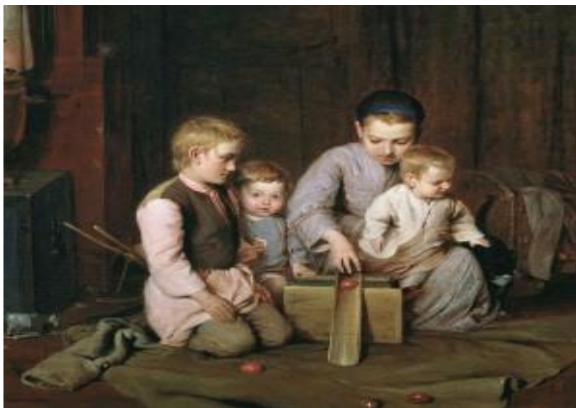
Иллюстрация: картина Н. А. Кошелев «Дети, катающие пасхальные яйца» . 1855г

Дорого яичко ко Христову дню. И не знал я долго: как и почему? Только слова Богу Он мне Сам открыл, Чтобы я яичко красное ценил. Взял я как-то в руки свежее яйцо. И смотрел я долго с думой на него. Ни костей, ни клюва, ни пера, ни ног. В том яйце я птицы увидеть не смог. Как же так бывает, где найти ответ, Птичка вдруг выходит из яйца, на свет.