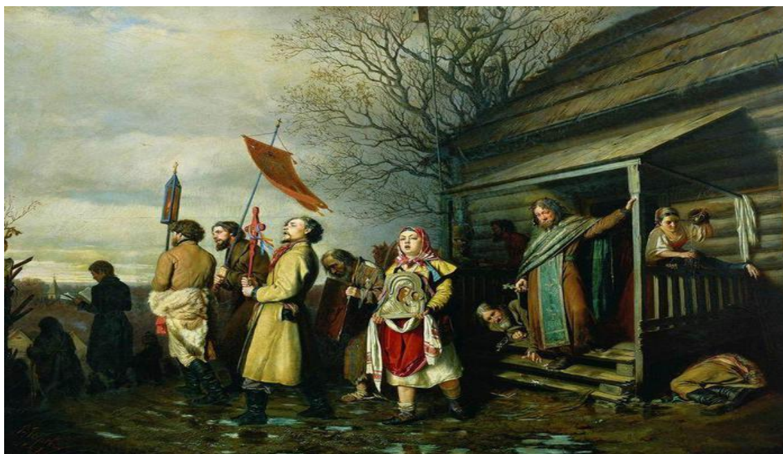
Иллюстрация: картина В. Перова "Сельский крестный ход на Пасху"

В день Пасхи, после шествия, утренней молитвы люди целуются или христосуются. При этом один говорит: «Христос воскрес!», а другой отвечает: «Воистину воскрес!» После этого дарят пасхальные крашеные яйца.