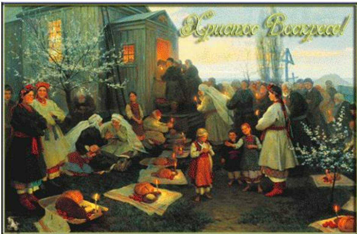
Иллюстрация: картина Н. К. Пимоненко «Пасхальная заутреня в Малороссии» 1891г

Пасха – праздник весенний. С приходом весны оживает природа. Взрослые и дети встречают весну хороводами, песнями, потешками, заличками.