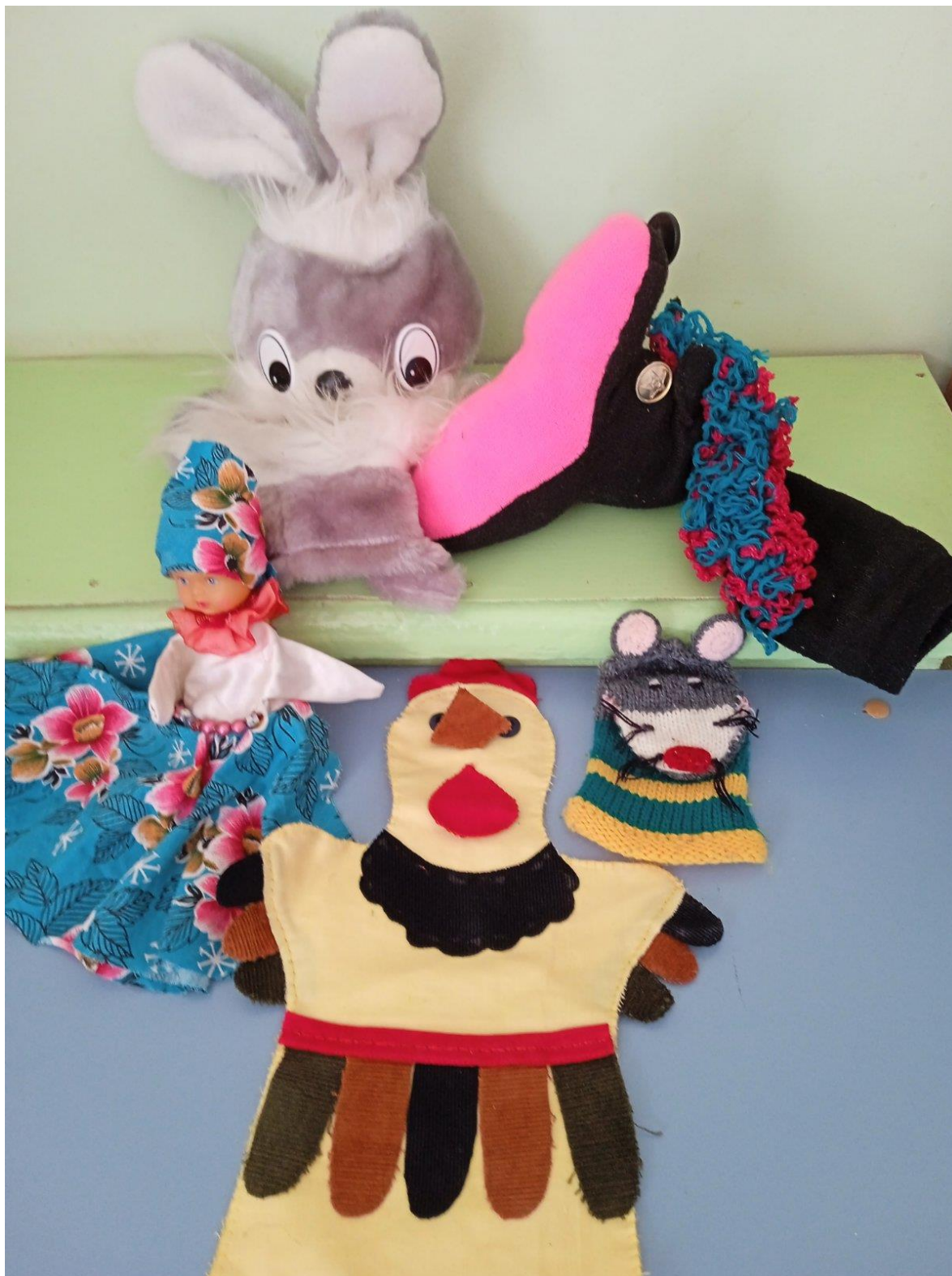
Куклы - самоделки