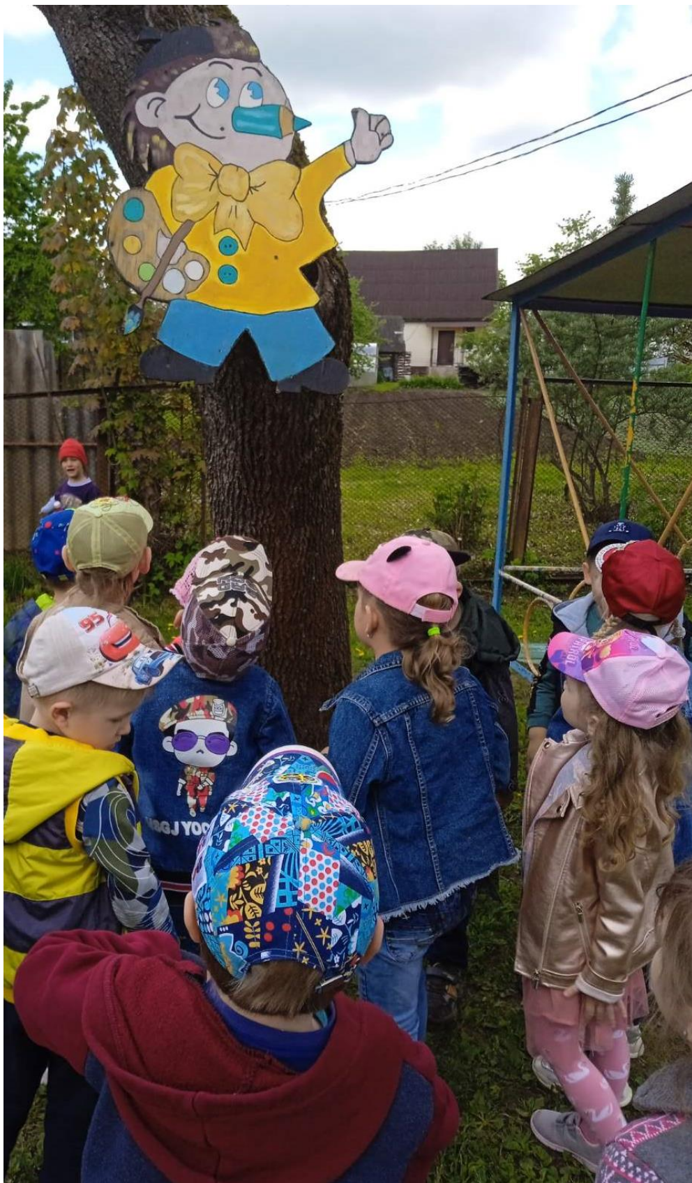
На сказочной тропе