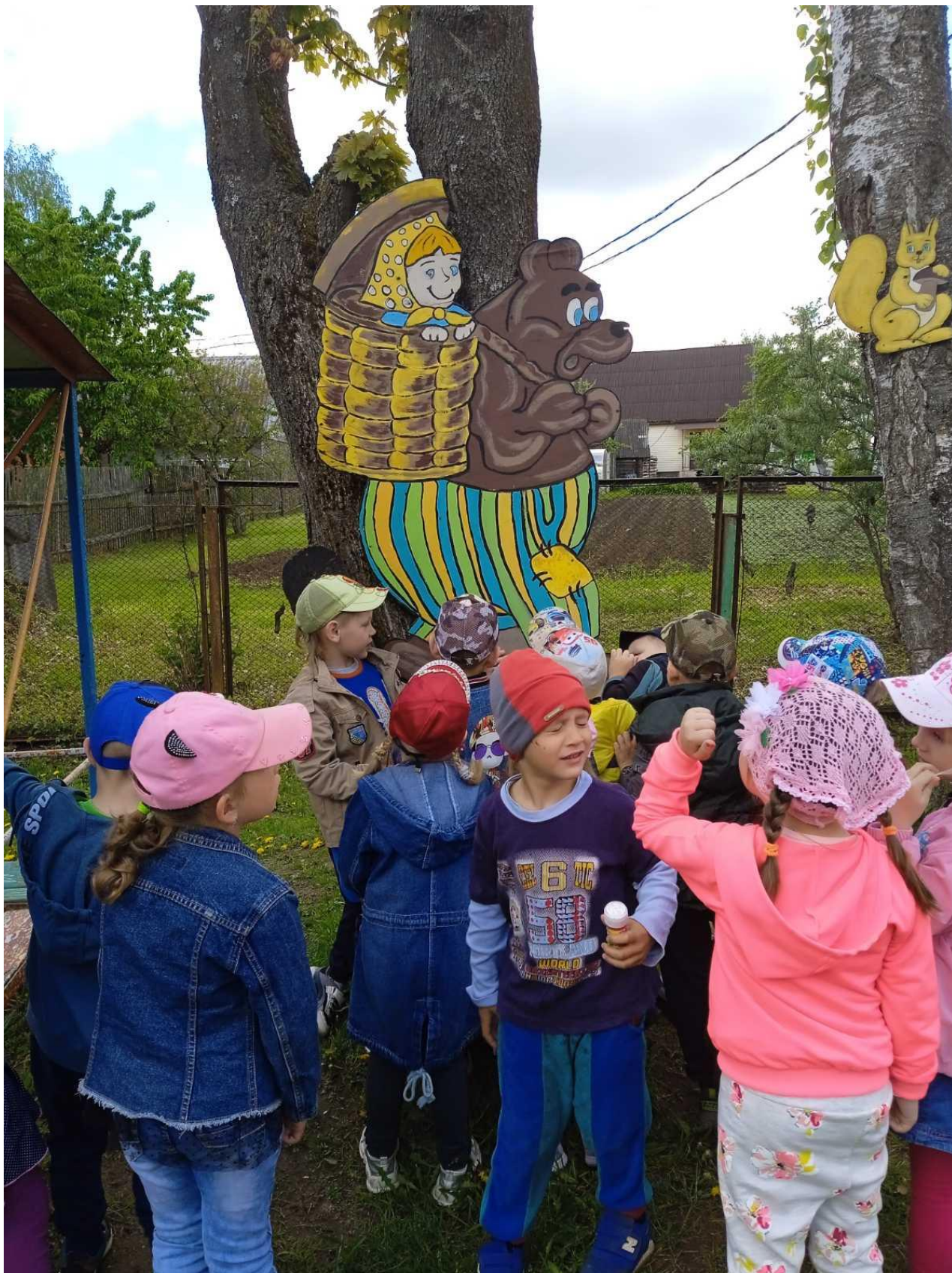
На сказочной тропе