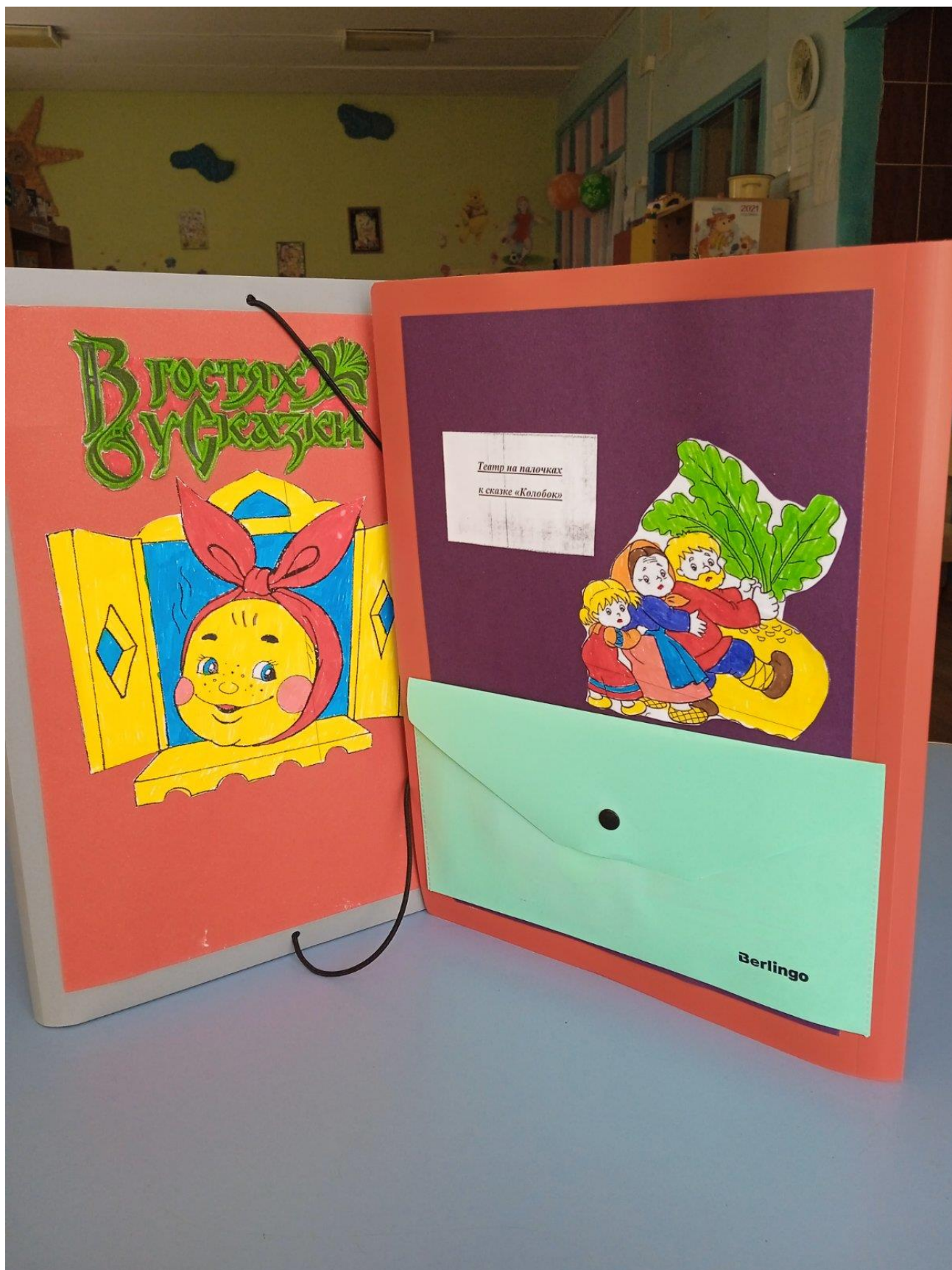
Лэпбук «В гостях у сказки»