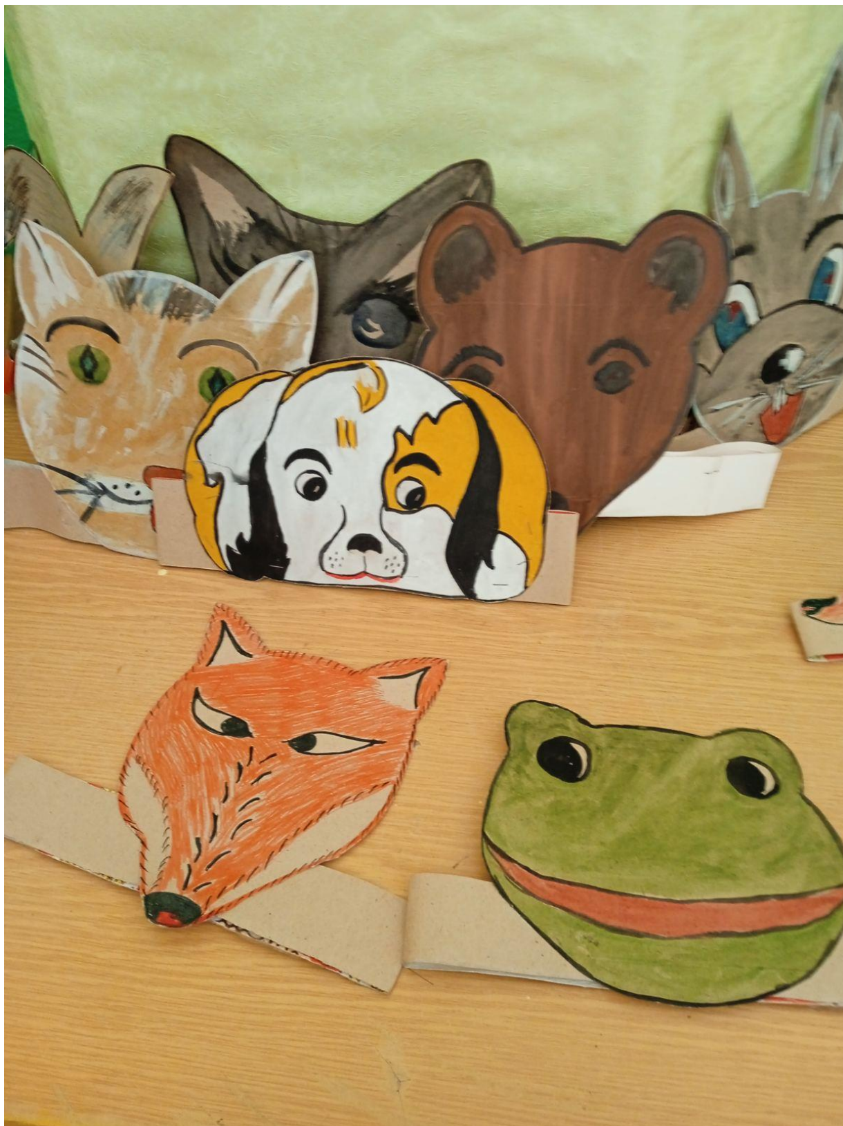
Маски своими руками