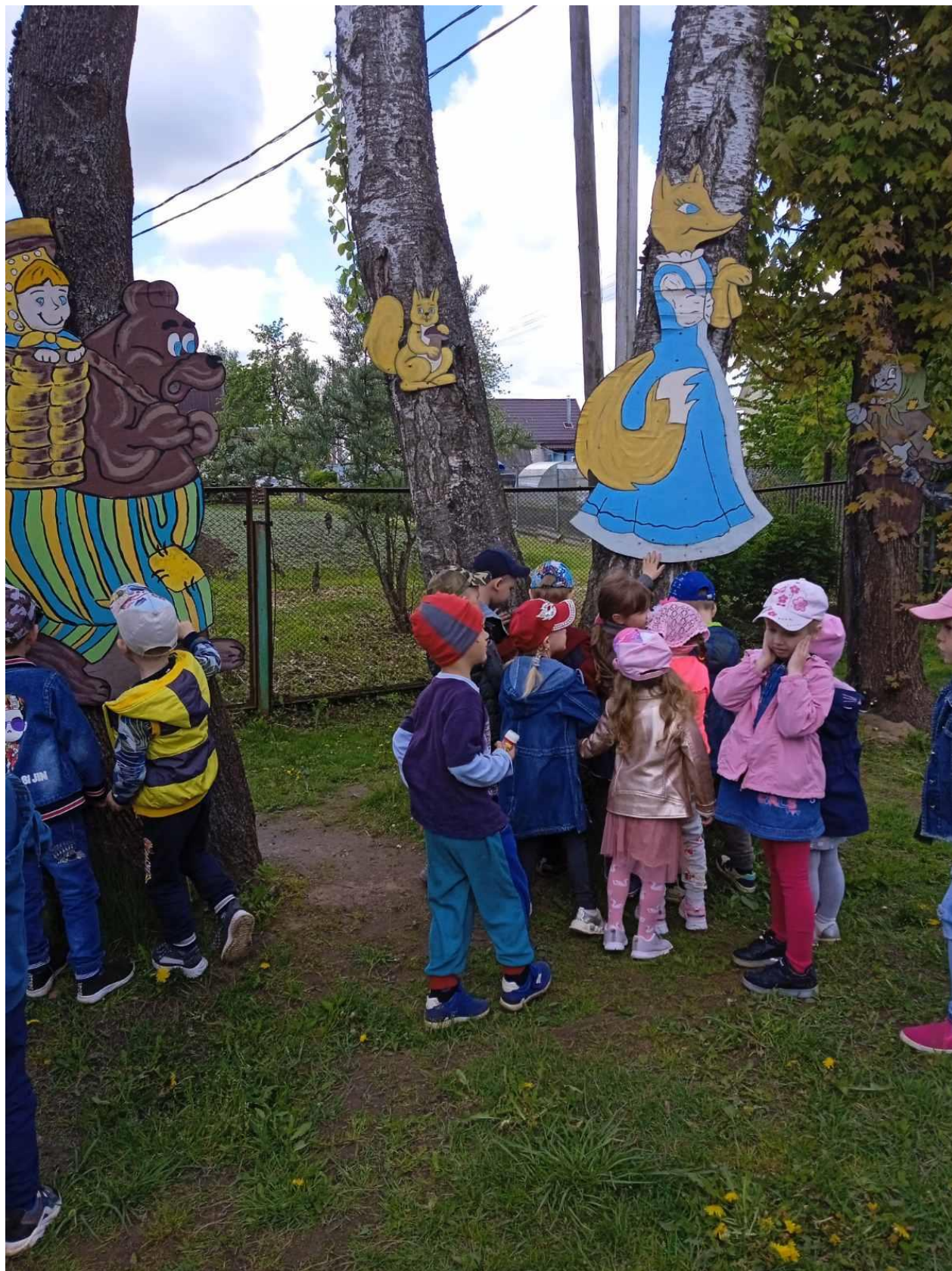
Станция «Сказочная поляна»