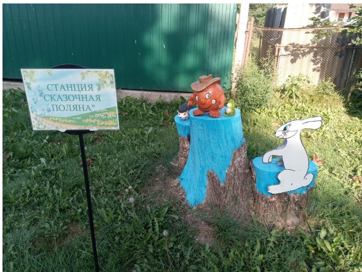
Станция «Сказочная поляна»