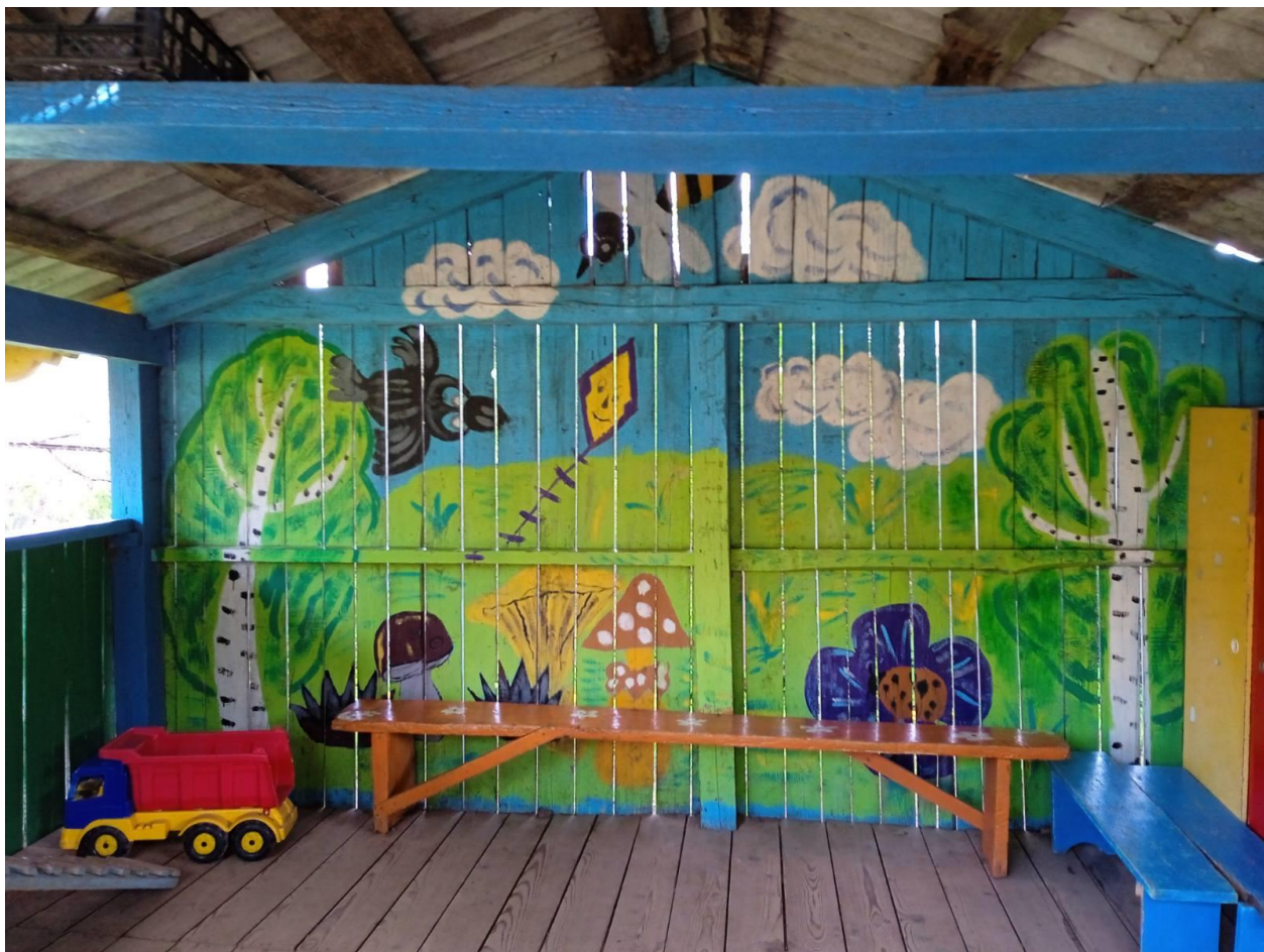
Станция «Сказочная поляна»