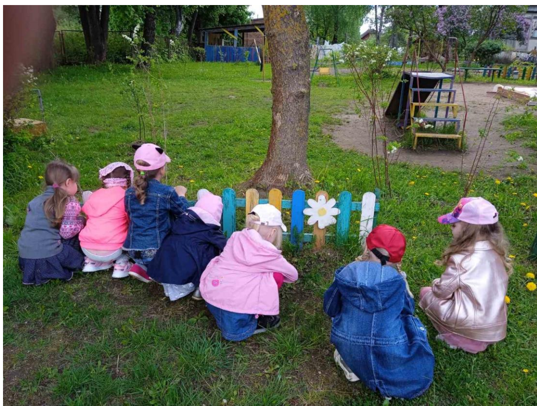
На сказочной тропе