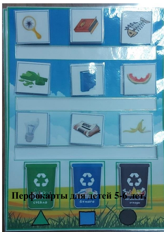
Перфокарты для детей 5-6 лет.