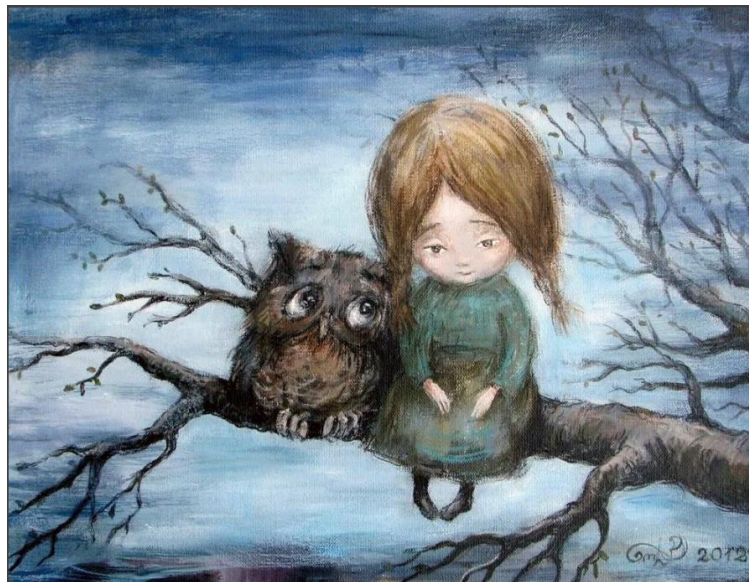
Картина с грустным настроением